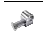
Optionals pag. 173

ACCESSORI DISPONIBILI A RICHIESTA OPTIONALS AVAILABLE ON REQUEST ДОПОЛНИТЕЛЬНЫЕ ОПЦИИ