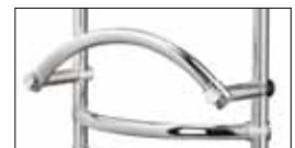
Optionals pag. 176