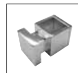
Optionals pag. 173

ACCESSORI DISPONIBILI A RICHIESTA OPTIONALS AVAILABLE ON REQUEST ДОПОЛНИТЕЛЬНЫЕ ОПЦИИ