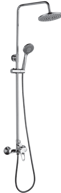
СМЕСИТЕЛЬ ДЛЯ ДУША «ТРОПИЧЕСКИЙ ДОЖДЬ»

В комплекте к смесителю прилагается паспорт изделия и гарантийный талон.