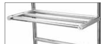
Optionals pag. 176