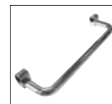
Optionals pag. 174

ACCESSORI DISPONIBILI A RICHIESTA OPTIONALS AVAILABLE ON REQUEST ДОПОЛНИТЕЛЬНЫЕ ОПЦИИ